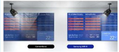
Image claire et brillante

Profitez d'une image brillante et d'une haute luminosité de 700 nits pour afficher des informations claires 24/7. Les panneaux antireflets 28% de la série VHR-R offrent une meilleure visibilité de contenus quelle que soit la lumière ambiante.