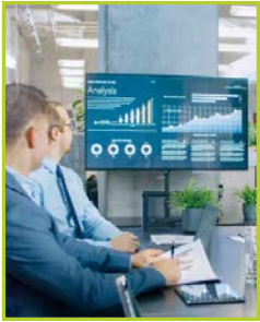
Communication point de vente