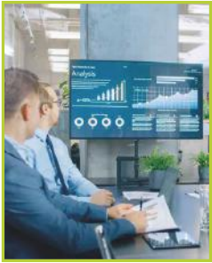
Communication point de vente