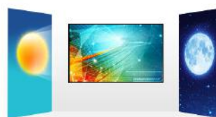
Capteur de lumière

Ces moniteurs 24/7 sont conçus pour une utilisation en continu.