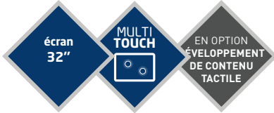
TABLE BASSE 32" VIRGINIE

Avec la résolution Full HD 1920x1080 et la technologie tactile capacitive projetée 10 points, cette table basse tactile de 32 pouces fournit une réponse tactile adéquate, technologique et design.