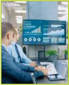
Communication point de vente